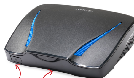
Porta USB Frontale: Stand-by Bottone e LED